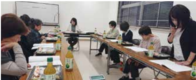
▲女性会新年度事業について協議を行った

詳しくは ハローワーク徳山 (☎ 0834-31-1950) 山口労働局職業安定部職業対策課 (☎ 083-995-0383)