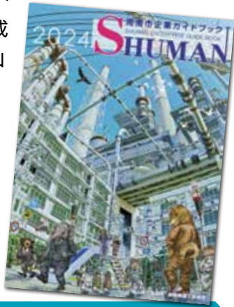
前回発行のガイドブック2024