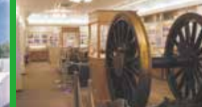
(株)日立製作所 笠戸事業所

消防本部内にある防災センターには、地震時の災害から避難脱出を体験できるパネェルシアターや、初期消火・地震・避難などの各体験コーナーを備えており、地域の皆様へ防災についての普及啓発に努めています。