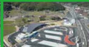
道の駅 ソレーネ周南

瀬戸内海に隣接する山里に面したボートレース徳山は、屋外スタンドから見られる競走水面とピットの距離が近く、選手の気合と臨場感が伝わります。自然の癒しとレースの迫力が楽しめます。