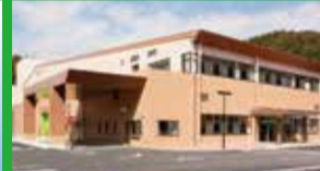
周南東部環境施設組合(えこぱーく)

和食にかかせないだしの素...「だし」の素や「つゆ」...を、さらにおいしく、さらに安全に、全国の食卓にお届けいたします。