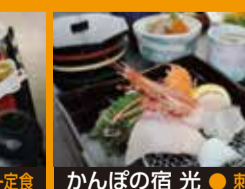
かんぼの宿 光 ● 刺身定食