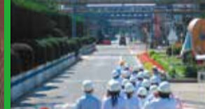
日本ゼオン(株)徳山工場

我が国で初めてステンレス冷延鋼板の大量生産を開始した周南製鋼所。「環境」「省エネルギー」による時代の求めるニーズに応えるステンレスを造り続けます。