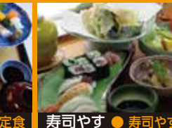
寿司やす ● 寿司やす定食