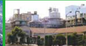
東ソー・シリカ(株)

アジア最長の生産拠点を誇る南陽事業所は、暮らしを支える各種製品を生み出し、循環型社会作りにも積極的に取り組んでいます。