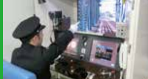
西日本旅客鉄道(株)徳山地域鉄道部

公共のガントリークレーンが2基、各社のストラフルキャリアが昼夜ヤードを走り回り、年間10万個のコンテナを扱う(構内通行には、ご注意を)