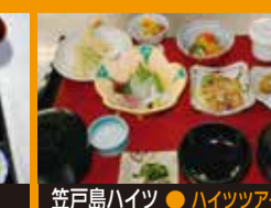
笠戸島ハイツ ● ハイツツアー定食