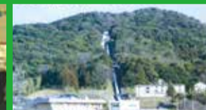
山口県企業局 東部発電事務所

周南工業水は、日量約70万トンの工業用水を周南地域の19社の工場に供給することにより、周南地域の経済活動の一翼を担っています。