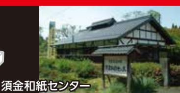
須金和紙センター