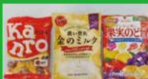
カンロ(株)ひかり工場

中国山系の大地を赤い年月をかけて通過された、地下百メートルから汲み上げた天然地下水は、うどん・そばづくりに最適。美しい自然に囲まれた環境で、清涼な水の恵みを活かし、磨きあげた確かな味をお届けしてまいります。