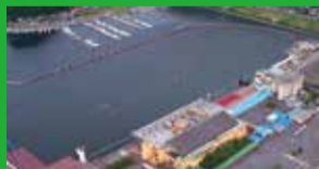
ボートレース徳山

私たちは、お客様の口に運ばれる瞬間のことを考えながら、ひとつひとつ丁寧にお菓子を作ります。材料の多くを県産にする等、「山口県」という地域にこだわっており、「山口の味と伝統」を全国に発信していきます。