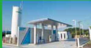
水素ステーション

当社工場の製造設備は立体的かつ機能的に配置されており、少量多品目への対応が容易であると共に、計画、製造、試験、出荷までの各業務を情報ネットワークで結んでいます。