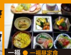
一福 ● 一福昼定食