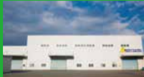
(株)ただおザウルス

「イワタニ水素ステーション 山口周南」は、中国エリア初の商用水素ステーション。臨海部を中心に立地する多くの化学メーカーから水素が生産される山口県において、水素エネルギー利活用拡大の拠点を担います。