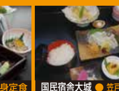
国民舎大城 ● 笠戸ひらめ御膳