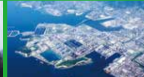
東ソー(株)南陽事業所

原油を燃料として発電を行う火力発電所です。廃止になった1号機は見学用に展示しています。屋上から下松市内が一望できます。