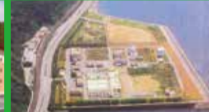
周南流域下水道浄化センター

リサイクルセンター「えこぱーく」では、下松市・光市の約11万人の家庭から出る燃やせないごみをリサイクルする中間処理及び適正な処理をするため、平成20年4月より稼働しており、限りある資源の有効活用を積極的に進めるとともに、埋立て処分量の減少と埋立地の延命化を図っています。