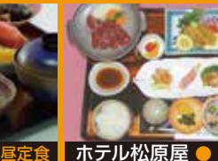
ホテル松原屋 ● 松原御膳