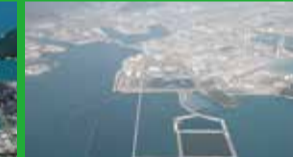
徳山下松港新南陽広域最終処分場

トクヤマは化学の力で生活に役立つモノを作っています。塩からガラスや石けん、砂からコンピュータが。そんな不思議がたくさん。地球と共に生きていきます