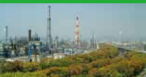
出光興産(株)徳山事業所

情報産業の最先端としての印刷業に挑戦します。 多様化する印刷物を先進の技術と最新鋭の設備で、事務用印刷なら西日本屈指の実績を持っています。また、印刷業のさらなる飛躍のためデータプリントサービスやICタグにも取組んでいます。