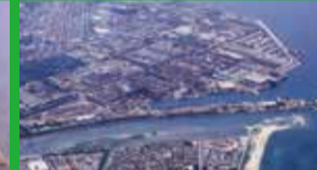
新日鐵住金ステンレス(株)製造本部光製造所

周南流域下水道の整備により、光市虹ヶ浜付近へ流れる島田川の水質が改善され、虹ヶ浜も良好な水質に保たれています。また、当浄化センターから排出される汚泥などは、肥料や燃料としてリサイクルされます。