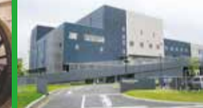
周南市リサイクルプラザ「ペガサス」

日立笠戸は創立以来、鉄道車両とともに歩んできました。当事業所内の歴史記念館では、これまで製造して来られた各種鉄道車両や産業プラント関連装置等の写真や模型、各種資料がご覧いただけます。