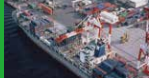
徳山コンテナ・ターミナル

周南地区をはじめとする山口県内から発生する産業廃棄物や周南市から発生する一般廃棄物の埋立処分を行っています。