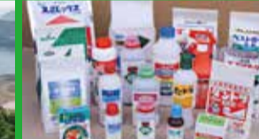
住化アグリ製造(株)

貯炭場は、全体を膜で覆われた六角形の環状型をしており、高さ45m、直径260mで容積5万トンの石炭山6つからなる、石炭中継基地の中心的設備です。