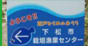
(公財)下松市水産振興基金協会 下松市栽培漁業センター

清らかな花岡八幡宮の宮水を使用 下松市花岡の花は、米と良質の水に恵まれ、古くから酒造りが行われてきました。弊社は、昔からの造り方を大切に、旨さにごこだわりを持って、県産のお米を中心に丁寧に醸(じょう)造しています。