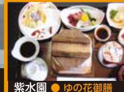
紫水園 ● ゆの花御膳