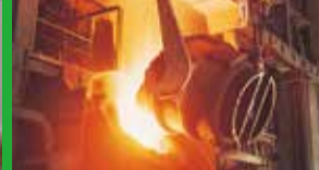
日新製鋼(株)周南製鋼所

私たちは、お客様に安心・快適にJRをご利用いただくために、日々、訓練を実施しています。この度はその一部ではありますが、「運転シミュレーター」による訓練を体験していただいたしたいと思います。