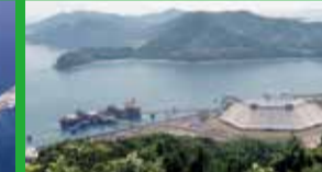
JXTGエネルギー(株)下松事業所

新日鐵住金ステンレス(株)の主力製造拠点である光製造所は、業界ナンバーワンメーカーとして、ステンレスを通じて社会に貢献します。