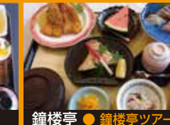
鐘樓亭 ● 鐘樓亭ツアー定食