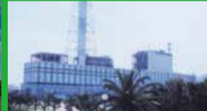
中国電力(株)下松発電所

現在捨てられているゴミの多くは、新しい資源としてリサイクルされています。環境に配慮した次世代型の産業廃棄物中間処理施設として、昨年稼働開始した新しい工場です。