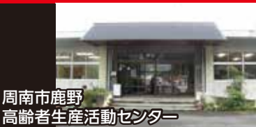
周南市鹿野 高齢者生産活動センター