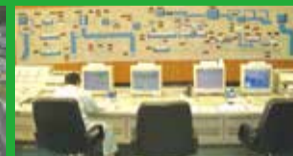
山口県企業局 周南工業用水道事務所

「海・山・里」からは新鮮な食を「コンビニエンス」からは技術・巧みな技を「人・街・地域」からは自然・歴史・伝統・文化を「癒し」「やすらぎ」「おもてなし」の心で全国に向け発信しています。